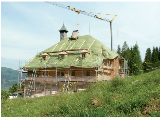
Vier Jahre lang wurde geplant und nun auch umfangreich saniert.